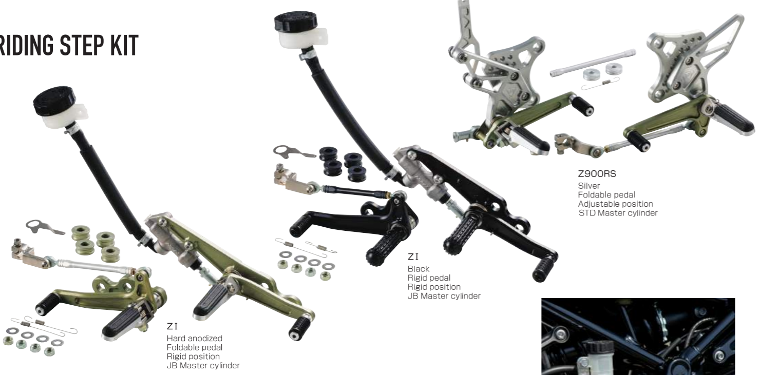
ZI Hard anodized Foldable pedal Rigid position JB Master cylinder