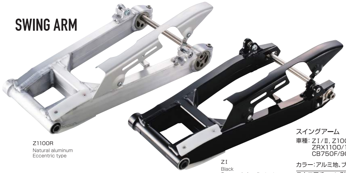
Z1100R Natural aluminum Eccentric type