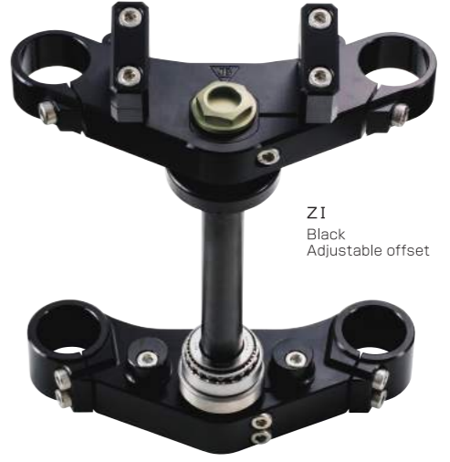
ZI Black Adjustable offset