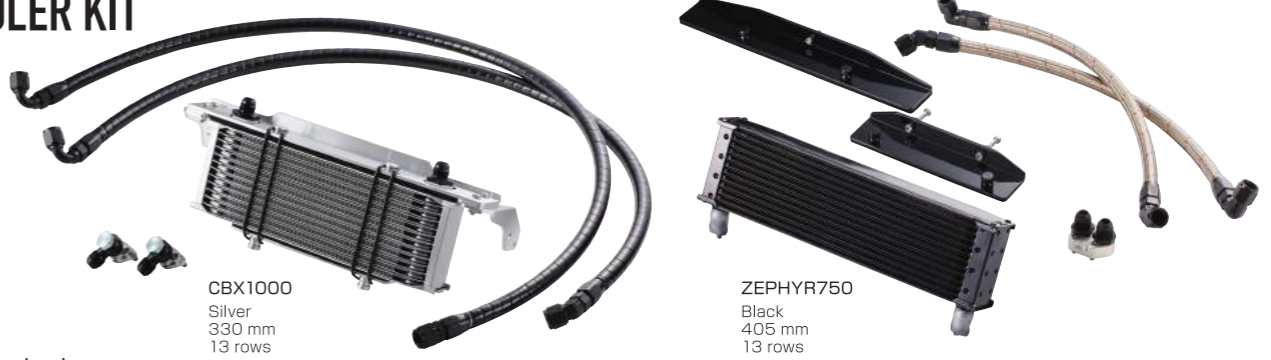
CBX1000 Silver 330 mm 13 rows