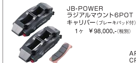
JB-POWER ラジアルマウント6POT キャリパー(ブレーキパッド付) 1ヶ ¥98,000.- (税別)