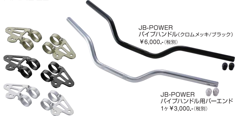
JB-POWER パイプハンドル(クロムメッキ/ブラック) ¥6,000.- (税別)