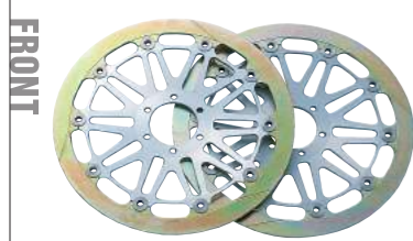
JB-POWER 鋳鉄フローティングディスクφ320 6POT用・2.4POT用 1枚 ¥75,000.- (税別)