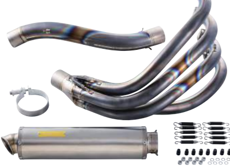
JB-POWER チタン手曲げ集合マフラー 4into1、チタンサイレンサー仕様 ¥250,000.- (税別)