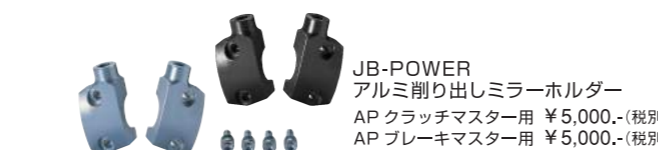
JB-POWER アルミ削り出しミラーホルダー AP クラッチマスター用 ¥5,000.- (税別) AP ブレーキマスター用 ¥5,000.- (税別)

ブレーキディスク ¥45,000.- (税別) / AP-RACING 2POTキャリパー CP2696 ¥62,000.- (税別) / ブレーキパッド ¥10,000 (税別) / キャリパーブラケット (カラー付き) ¥30,000 (税別) / アンカー ¥15,000 (税別) / トルクロッド ¥10,000 (税別)