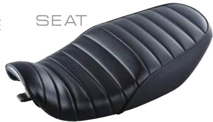
シート表皮張替 (アンコ抜き足し) タックロール ¥30,000.- (税別)