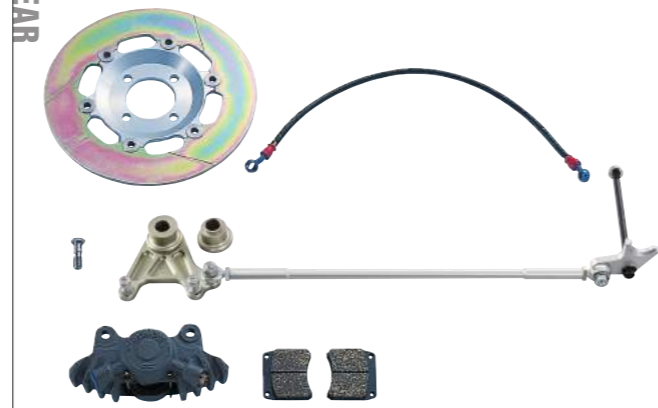
JB-POWERリアフローティングキット (鋳鉄φ250ブレーキローター/CP2696/ステンレスフィッティング) ¥184,600.- (税別)

ブレーキディスク ¥45,000.- (税別) / AP-RACING 2POTキャリパー CP2696 ¥62,000.- (税別) / ブレーキパッド ¥10,000 (税別) / キャリパーブラケット (カラー付き) ¥30,000 (税別) / アンカー ¥15,000 (税別) / トルクロッド ¥10,000 (税別)