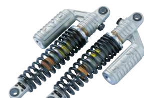
JB-POWER KYB リアショックアブソーバー KASAWAKI用 ¥75,000.- (税別) スプリング(1レート硬) ¥18,000.- (税別) フックレンチ ¥3,000.- (税別)