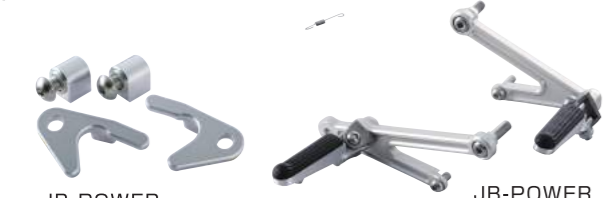
JB-POWER アルミ削り出し レーシングスタンドフック ¥10,000.- (税別)