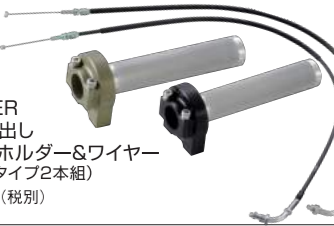
JB-POWER アルミ削り出しスロットホルダー&ワイヤー (ストレートタイプ2本組) ¥26,000.- (税別)