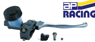
AP-RACING ブレーキマスターシリンダー CP3125-2 (ブレーキスイッチ付) ¥69,000.- (税別)