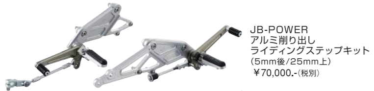
JB-POWER アルミ削り出し ライディングステップキット (5mm後/25mm上) ¥70,000.- (税別)