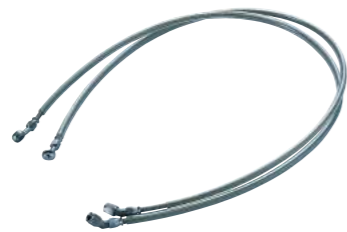
GOODRIDGE ステンレスメッシュホース EARL'S ステンレスフィッティング 1本 ¥11,000.- (税別)