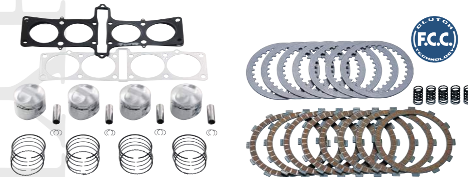
JB-POWER アルミ鍛造ピストンキット φ76 (排気量1135cc, 圧縮比11.0:1) ¥125,000.- (税別) φ80 (排気量1258cc, 圧縮比11.5:1) ¥130,000.- (税別)