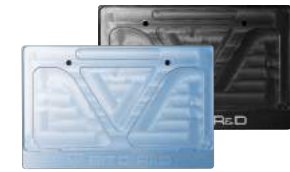
JB-POWER アルミ削り出しナンバープレートホルダー ¥16,000.- (税別)